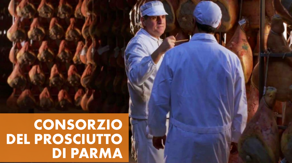
CONSORZIO DEL PROSCIUTTO DI PARMA